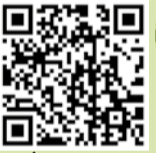
6 | ÉGLISE PAROISSIALE DE L'ASSOMPTION