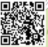
5 | MUSÉE D'ART CONTEMPORAIN